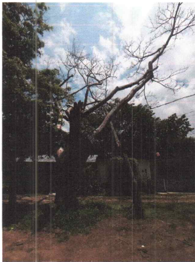
Imagen.- El tronco de los árboles de los palos mulatos, así como sus ramas se encuentran totalmente seco, con cavidad en su parte inferior del tronco y en sus ramas.